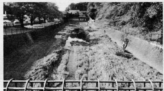
富士見町残堀川が綺麗に整備されました