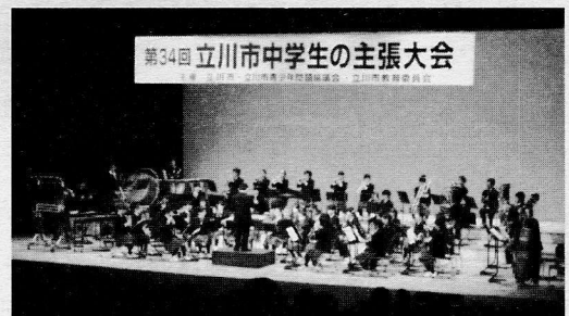
立川市中学生主張大会