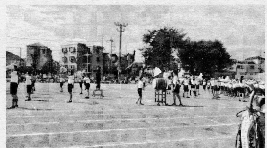
立川市立第四小学校運動会