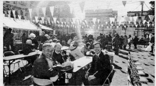
ウィンターフィスティバル